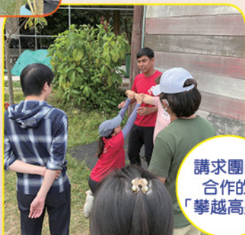
講求團隊合作的「攀越高牆」