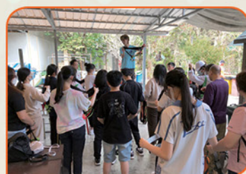
工作人員為參加者示範如何佩戴安全繩