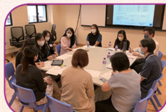
第一次執行委員會開會情況