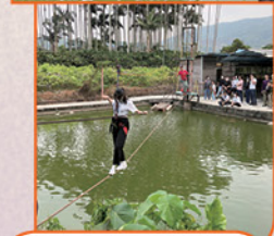
原來玩這個橫水渡真的不容易，既要講求平衡力，也需要耐力