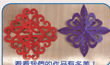
看看我們的作品有多美！