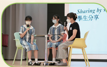
兩位同學以過來人的身份，為中一新生提出寶貴