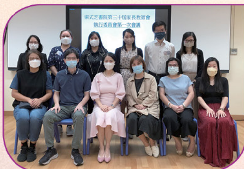
今屆家長教師會委員與校長合照