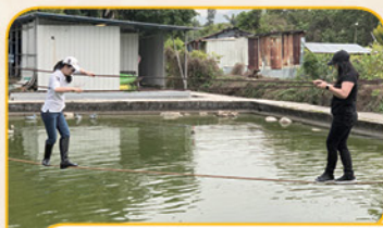
校長和副校長也來試這橫水渡