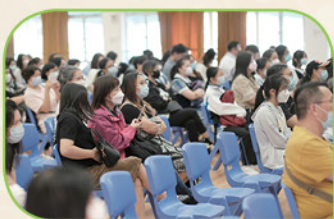
家長全神貫注地聆聽台上同學的分享

我們很高興能參與第三十屆家長教師會周年大會。聽過兩位畢業生的分享，我學懂了如何安排溫習的時間。希望我可以借助這兩位師姐的經驗來完善我的學業。