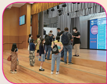
家長和同學們都積極地向老師提問