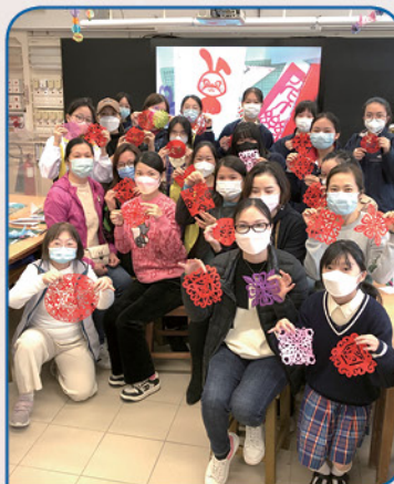
大家對自己的作品都感到十分滿意

星期六下午我和媽媽一起前往學校參加剪紙活動。期間，老師教我們傳統剪紙的花紋，而我最喜歡的就是水滴紋。不僅如此，我們還嘗試各式各樣的花紋剪法，甚至可以天馬行空，利用自己的想像力創造屬於自己的圖案，我和媽媽樂在其中！為了配合新年氣氛，老師甚至派發了洋溢著農曆新年氣氛的紅宣紙，好讓我們剪出新年窗花，為大年初一做好準備。可惜，快樂的時間總過得快，我們依依不捨的放下剪刀，收拾好垃圾，便離開學校。