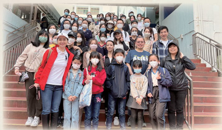
出發前先來個大合照

當日令我最難忘的是攀樹，因為在日常生活很難有機會攀上高處，同時能感受大自然的清新空氣，而且整個過程十分安全。攀樹考驗的是我們的膽量，平日可能我們會因為害怕而不敢勇於嘗試新事物，通過攀樹令我領悟出道理——其實只要我們願意踏出第一步就能成功。我認為學校舉辦這次親子旅行，可以令我們暫時忘記學業上的煩惱，並好好享受大自然的樂趣。